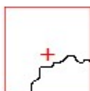
Demolizione e ricostruzione